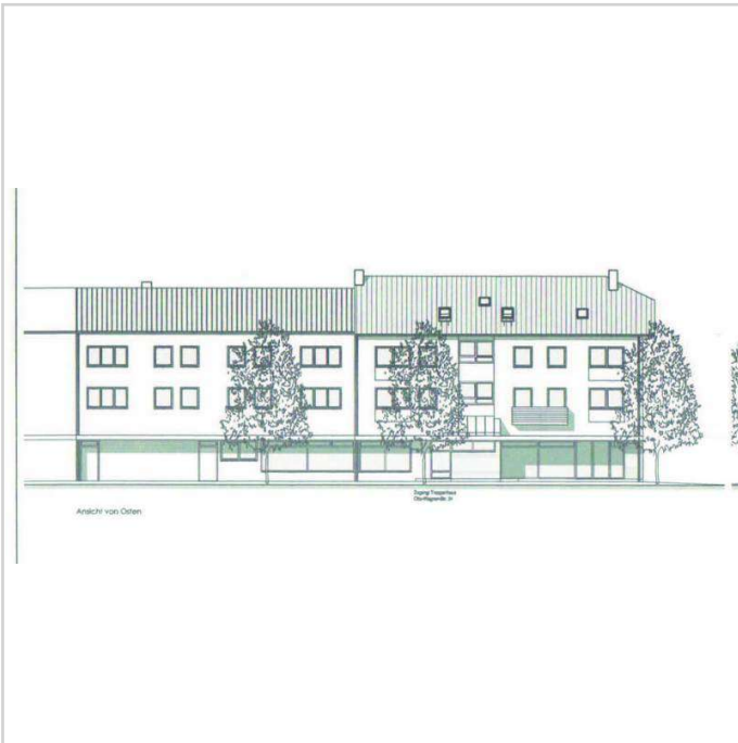
Schnitt Otto-Wagn. 34-001